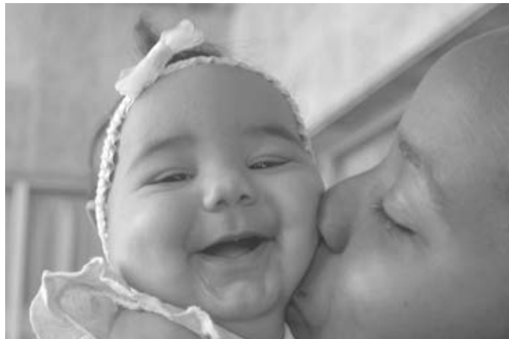
En el 2016, la tasa de mortalidad infantil en la provincia cerró en 4,3 por cada mil nacidos vivos.

Otro dato significativo es que este año el 17 % de las madres son adolescentes menores de 17 años, y aunque todos los embarazos tuvieron un feliz término, la precocidad para asumir esa responsabilidad muestra que es necesario reforzar la labor preventiva para evitar la gestación en la adolescencia. (ACN)