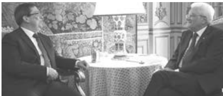
El canciller cubano Bruno Rodríguez Parrilla se reunió con el mandatario italiano Sergio Mattarella (derecha).

También intercambiaron sobre el actual escenario