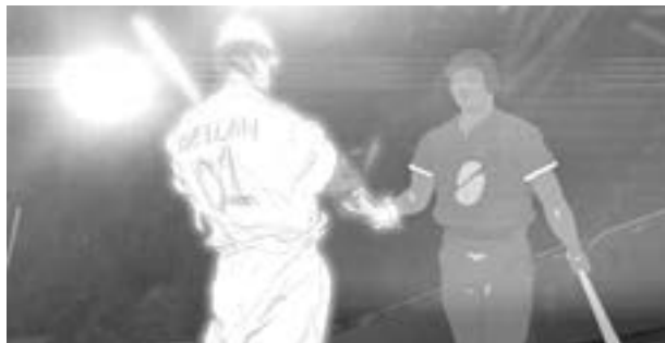
Ilustración de Los inicios del béisbol.

Asegura la publicación que cada capítulo, de 50 segundos, ha sido realizado con la técnica de animación 2D. Los espacios físicos en que se desarrollan