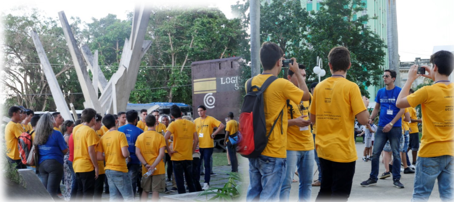
Monumento al Tren Blindado