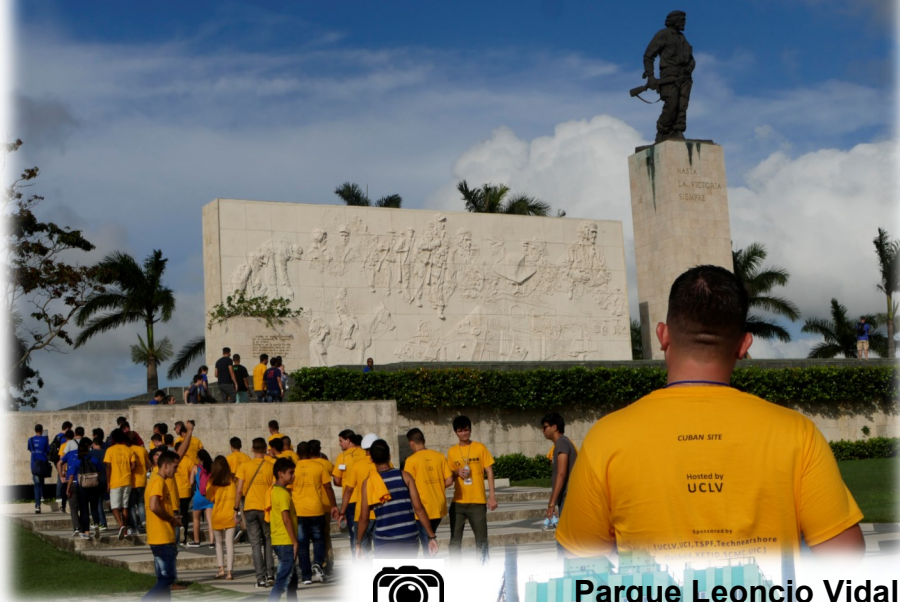
Complejo escultórico Ernesto "Che" Guevara