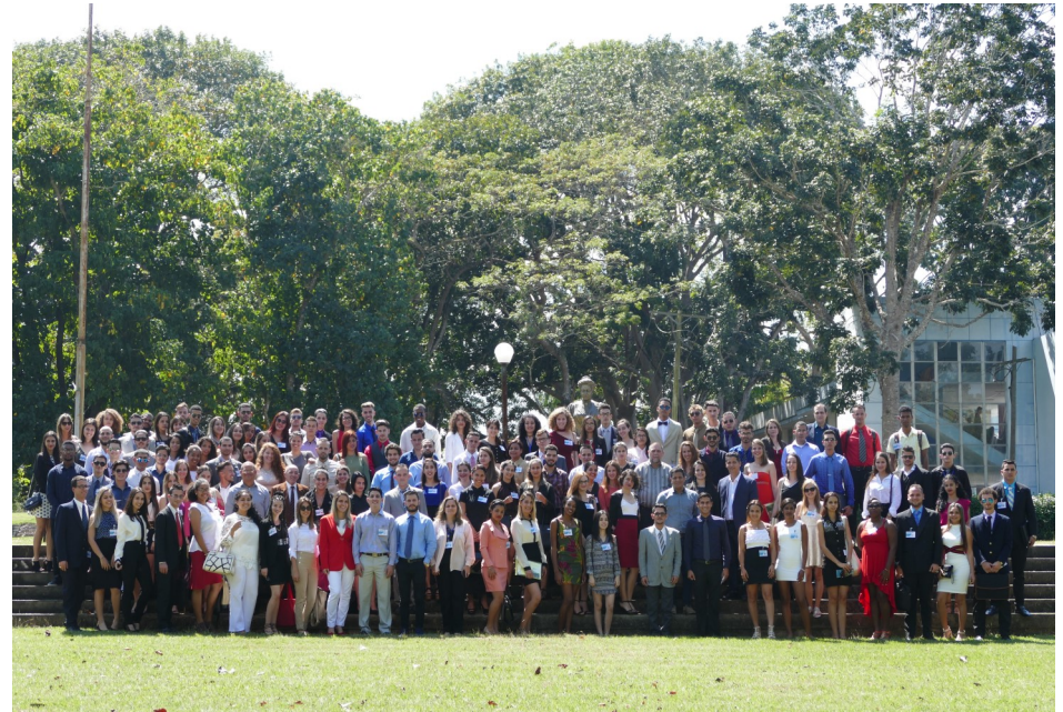
Por Mónica Sardiña