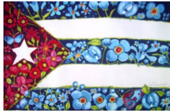
Aniversario 60 del triunfo de la Revolución Cubana