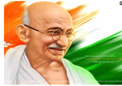
Aniversario 150 del nacimiento de Mahatma Gandhi