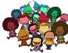
Aniversario 30 de la firma de la Declaración Universal de los Derechos del Niño