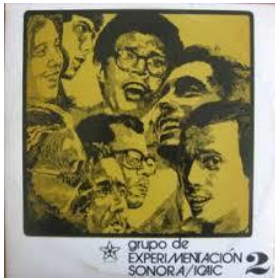
Longina 2020 dedicado al GESI.

Bajo el auspicio de la AHS, se desarrollará en la ciudad de Santa Clara el Encuentro Nacional de Trovadores Longina canta a Corona del 8 al 12 de enero de 2020. El evento, organizado por los trovadores del patio, es apoyado por la Dirección Provincial de Cultura y diversas instituciones que crecen, cada año, afanados a defender la canción trovadoresca.